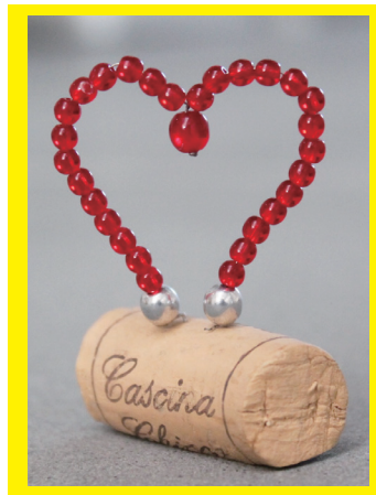
ハートのオブジェ

昨年7月よりはじまったジャン＝ミシェル オトニエル 愛の遺伝子展 “DNA of Love” を記念し、大好評だった ワークショップをホワイトデーに特別開催しちゃいます♪ オトニエルの作品をイメージして、チェコビーズでプレスレットと ハートのオブジェが作れます。ぜひお試しください^v^ 本物の作品の目の前でのワークショップは貴重な体験です！ ぜひご参加ください♪