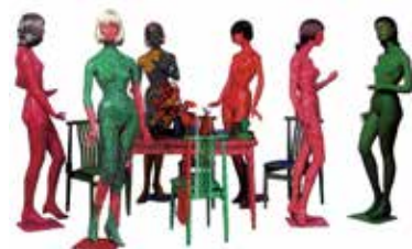
Self-Obliteration / Mixed media / 1966-74 / Variable

立体、 インスタレーション や平面の作品を展示。 ギャラリー で草間彌生に遭遇できます。 来年3月 までの展示予定です。