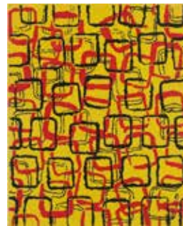
Untitled, Copperplate print, 44.5x35.7, 2012, ED4

具体美術協会創設メンバーで72年の解散時まで在籍、現在も 活動中 の上前作品を展示。精密で繊細な 表現力 を直にお確かめください。本画を含めて 約30点 展示販売しています。