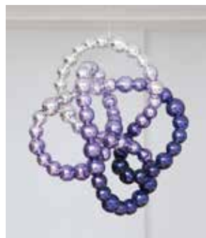
Noeud alessandrita miroir 青紫色の結び目/2014/70 x 65 x 35