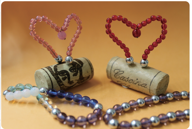
ブレスレットとハートのオブジェ

軽井沢ニューアートミュージアムでは1年にわたり フランス現代美術作家ジャン=ミシェルオトニエルの 作品をご紹介してきました。