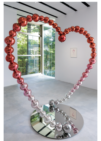
Pink Kokoro 2014

本物の作品の目の前でワークショップは 貴重なアート体験です！ぜひご参加ください。