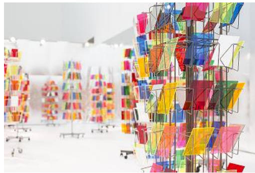
鬼頭健吾《active galaxy》 群馬県立近代美術館、2015 active galaxy